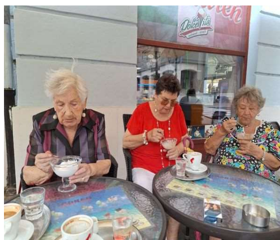
Kávičkujeme v kaviarni