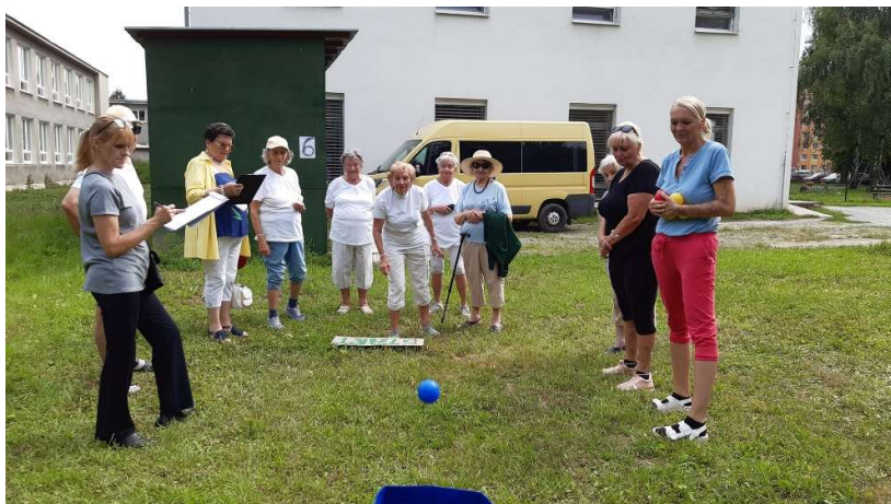
Šport a súťaženie