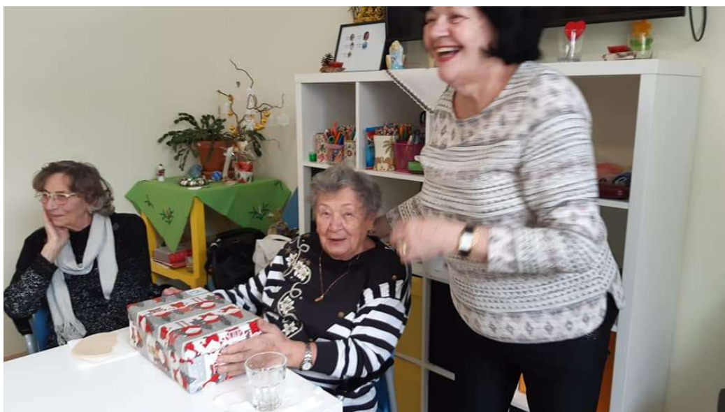
Vianočná kapustnica a rozdanie darčiekov

Záver roka sme si spríjmnili už tradične posedením pri sviatočnom stole, na ktorom nesmeli chýbať tradičné vianočné jedlá a prišiel aj náš pán riaditeľ. Nezabudol na nás ani Mikuláš a ani Ježiško a doniesli nám darčeky. Do nového roka sa pozeráme optimisticky. Popriali sme si hlavne zdravie a šťastie, rodinnú pohodu a Božie požehnanie. Veríme, že sa takto budeme môcť stretávať ešte dlho.