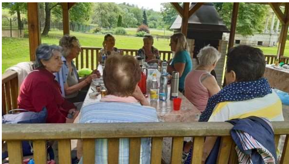
Spoločné prechádzky spojené s grilovaním na Cemjate